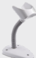
▪ STD-G040-WH: Basic Stand, G040, Blanc